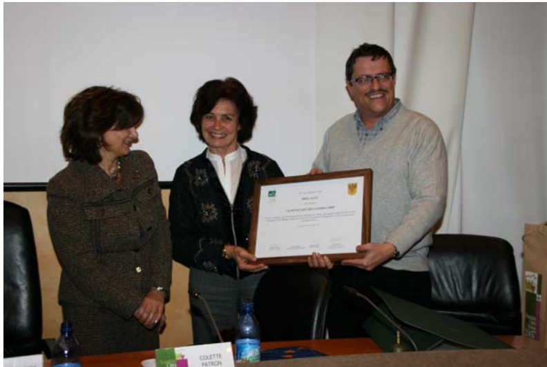
Remise de son titre à la ville de Brigue-Glis. Sondrio, 30/11/2007