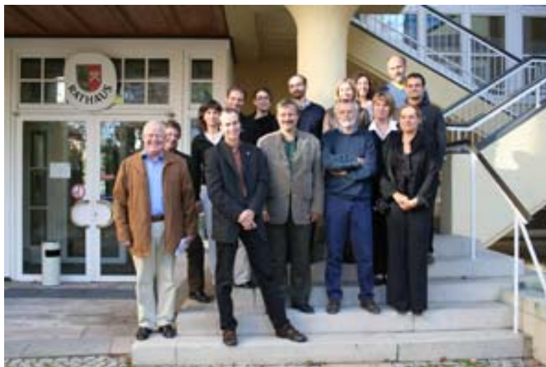
Les partenaires potentiels du projet se sont réunis pour un atelier de travail à Kempten/Sonthofen