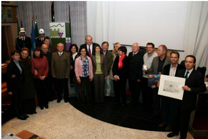
Photo de groupe des représentant-e-s des Villes des Alpes de l'Année, Sondrio, 30/11/2007

En 2007, l'Association Ville des Alpes de l'Année a fêté ses 10 ans d'existence. Dans le cadre des festivités de clôture organisées à Sondrio, les Villes des Alpes ont échangé des présents symboliques afin de célébrer l'événement. Le Secrétariat a en outre profité de l'occasion pour publier une nouvelle brochure d'information, qui présente brièvement les cinq objectifs de l'Association et les villes déjà lauréates. Cette brochure, disponible sur Internet, a été remise au format papier et au format électronique à toutes les Villes des Alpes de l'Année, au jury et au Secrétariat permanent de la Convention alpine. Le Secrétariat a également pris contact avec une société de films documentaires qui souhaiterait tourner un documentaire sur les Villes des Alpes de l'Année. Afin de mieux faire connaître ces festivités au public, un communiqué de presse a été rédigé en quatre langues et envoyé à 2500 adresses de presse.