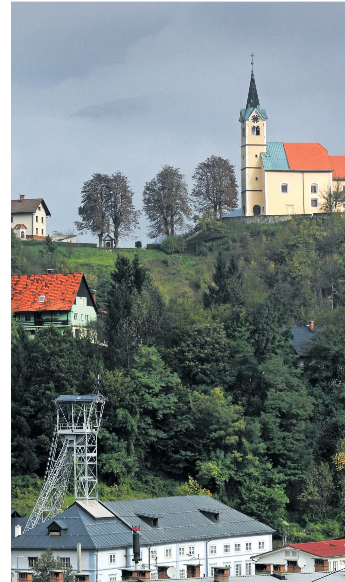
Oben das Himmelsversprechen, unten das Schufien im Bauch der Erde: In Idrija ist alles an seinem Platz.

Als die Gruben nach dem Zweiten Weltkrieg jugoslawisches Staatseigentum wurden, hatten sie nichts an Bedeu-